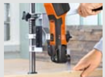
Werkstatt und Modellbau