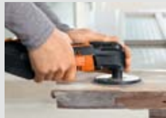
Fenster und Tore