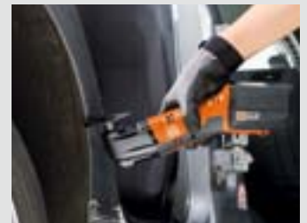
Rund ums Auto